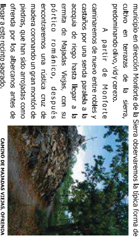
CAMINO DE MADRAS VIEJAS, ORDENDA

Este sendero conocido en Europa como E-7, atraviesa el Parque Natural de las Batuecas-Sierra de Francia de este a oeste a lo largo de 48,5 km, incluyendo dos pequeñas variantes. Si bien se puede hacer todo el recorrido completo por la provincia de Salamanca desde el municipio de La Hoya hasta el de Aldea del Obispo, para los más atrevidos que se quieran aventurar a hacerlo completo, tendrían que atravesar la Península Ibérica desde Playa de Mar (Valencia) hasta Lisboa (Portugal) tras recorrer unos 1.200 km. Iniciamos el recorrido por el Parque Natural en la denominada: "Travesía de la Sierra de Francia" en el municipio de Sotoserrano, junto a la iglesia de Nuestra Señora de la Asunción. El trayecto hasta Cepeda transurre en un primer tramo entre cultivos de cerezas y olivos, más adelante se adelanta, por una pista forestal, en un bosque de pino, acebo, medorrío y roble en su mayor parte. Por el camino nos cruzaremos con otro sendero que nos llevaría a Herquijuela de la Sierra y Medoroñal, cruzaremos el arroyo San Pedro del Coso por un hermoso puente medieval en la Dehesa de Cepeda que nos lleva hasta dicho municipio.